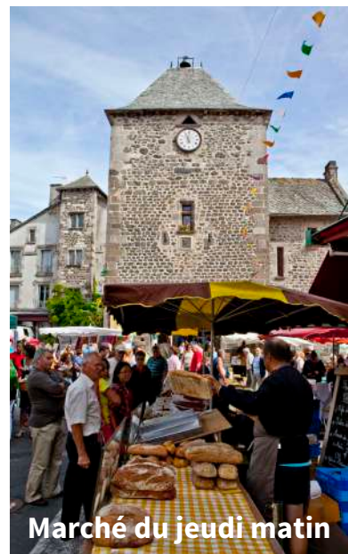
Marché du jeudi matin

- Au XII e -XIII e siècle, Mur-de-Barrez est qualifié non plus de bourg mais de ville véritable, édifiée sur l'une des routes d'échanges commerciaux entre l'Auvergne et le Languedoc. Le château de Mur-de-Barrez est « fort » et dépend directement des vicomtes de Carlat, comtes de Rodez qui en font leur résidence d'été. Les estivadas de troupeaux provenant du Quercy et du Rouergue sont nombreuses à se rendre sur les flancs des Monts d'Auvergne.