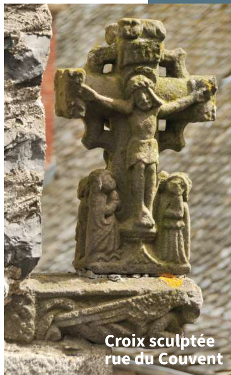
Croix sculptée rue du Couvent

De retour au point 6, regagnez le centre par la rue du pont Romain et rejoignez la Rue du Valat. Ancien fossé appelé « Lou Bolat » en langue d'Oc, il délimitait le vieux village médiéval jusqu'au XVIII ème siècle. Au XIX ème siècle, c'était la rue principale, elle accueillait de nombreux ateliers de coutelleriers. C'est là qu'est né l'artisanat si réputé du village.