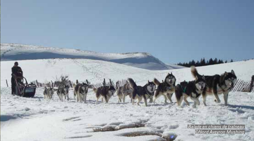
Balade en chiens de traîneau