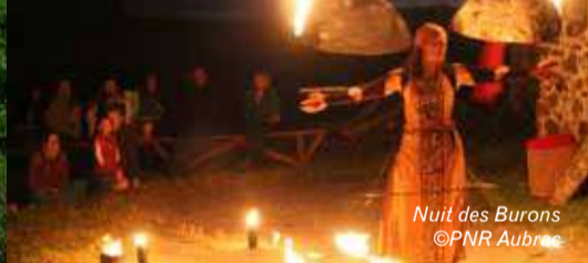
Nuit des Burons