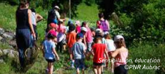
Sensibilisation, éducation