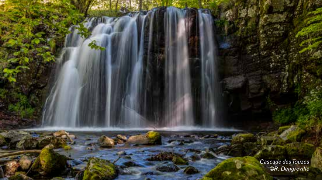
Cascade des Touzes