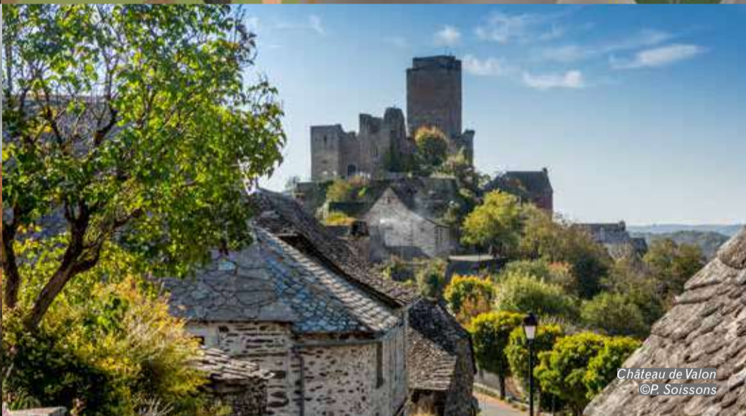
Château de Valon