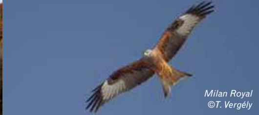
Milan Royal