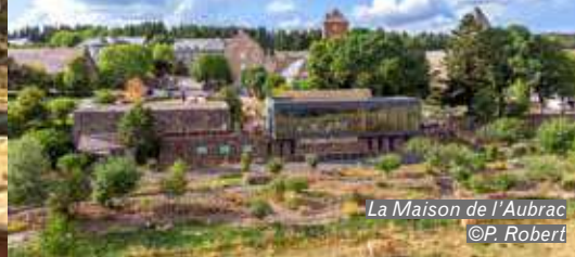
La Maison de l'Aubrac