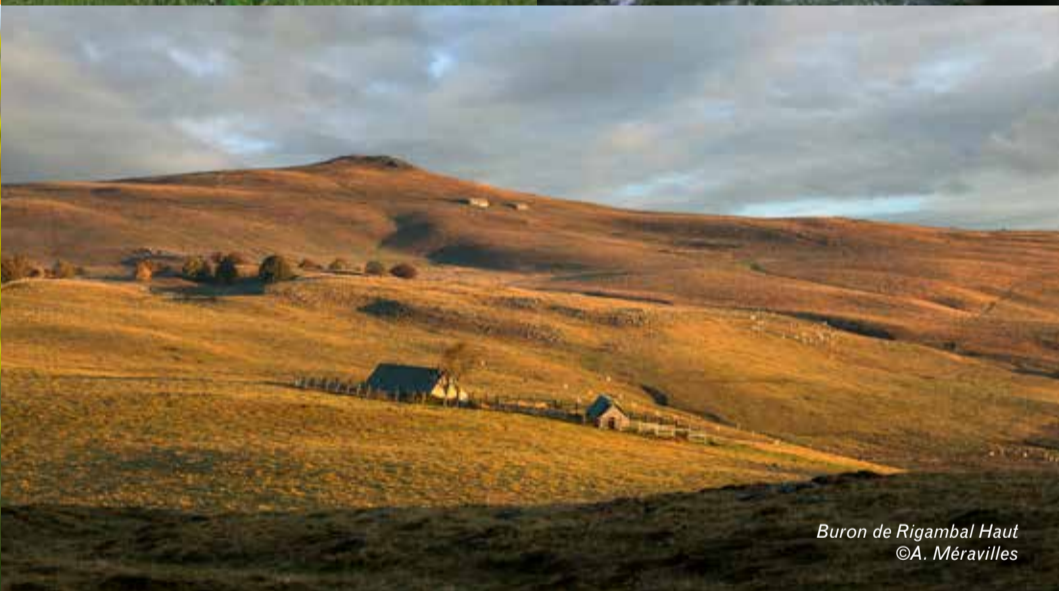
Buron de Rigambal Haut