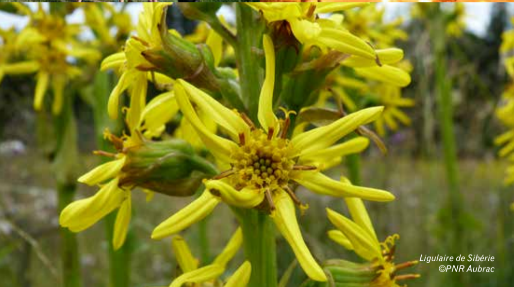
Ligulaire de Sibérie