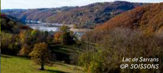
Lac de Sarrans