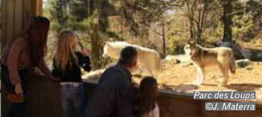
Parc des Loups